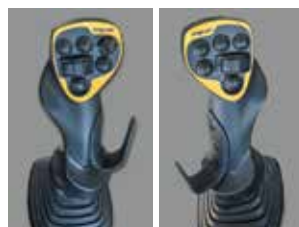
조이스틱 조향 (옵션) NEW

작업 중 차속이 0 km/h이 되면 자동으로 브레이크가 작동하고 가속페달 조작 시 자동해제