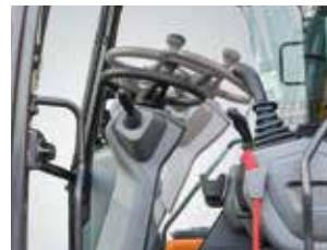
신규 텔레스코픽 조향 컬럼

핸들의 높이 및 틸팅각도 조정 가능 신규 디자인 적용으로 두께가 축소 되어 전방 시야성 및 거주편의성 개선