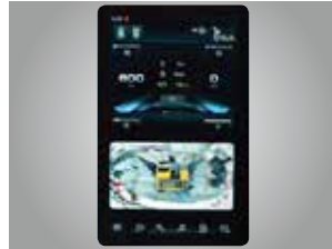
12인치 안드로이드 계기판 NEW 스마트키

시인성이 향상된 12인치 계기판, 통풍기능의 인조가죽 시트 등 운전자를 최우선으로 생각한 설계로 보다 편안하고 쾌적한 작업공간을 제공하며 장비 주변의 사람만 감지하여 알려주는 스마트 AVM시스템으로 이제 마음 놓고 작업하실 수 있습니다.