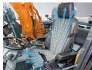
통풍 & 인조가죽 시트

조이스틱에서 손을 떼지 않고 좌/우 조향이 가능하며 작업편의성 향상 (앵콘 릴트로테이터 옵션 선택 시 적용)