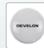
GNSS 메인/보조 안테나