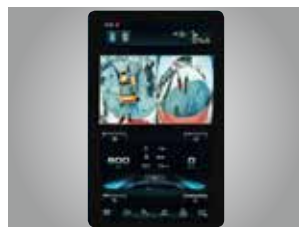
스마트 AVM (옵션) NEW

장비 주변의 360°상황을 한 눈에 볼 수 있으며 장비 주변의 사람만 감지하여 알람 제공