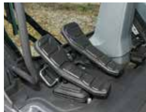
새로운 디자인의 페달

조작이 편리한 신규 디자인의 키패드 적용하여 스위치 접근성 및 조작 편의성 증대